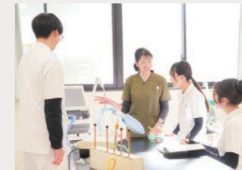
[生体計測装置学実習]