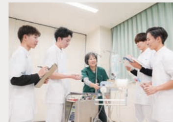
[生体機能代行装置学実習(循環)]