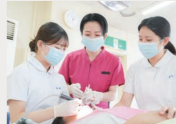
[スクレーリング実習]