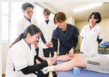
[スポーツトレーナー特別講義]

柔道整復理論 / 柔道整復実技 / 包帯固定学 / 柔道実技 / スポーツトレーナー特別講義 など