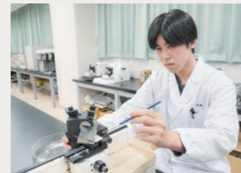
[病理検査実習(病理組織標本作製)]

一般検査学 / 生理機能検査学演習 / 化学検査学実習 / 病理検査学実習 / 微生物学検査学実習 / 免疫検査学 / 輸血移植検査学実習 など