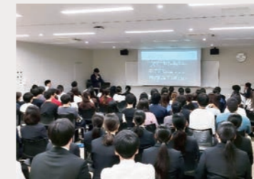
[臨地実習のテーマ発表]