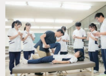
[疾患別評価学演習 II]