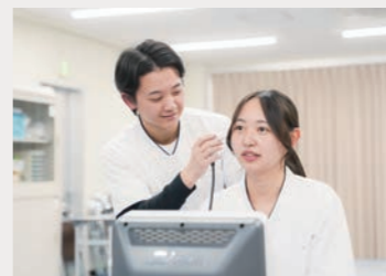
[疾患別評価学演習]